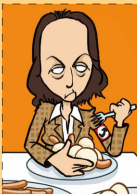
BEATRIX VON STORCH