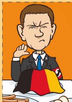
BERND »BJÖRN« HÖCKE